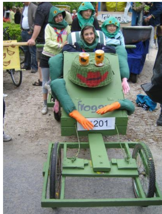
Tidligere Peter Lassen vogne